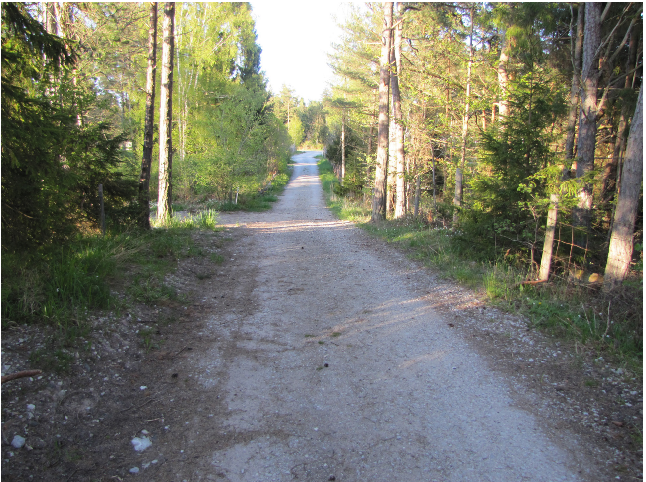
Smidskovägen, 18 maj 2015